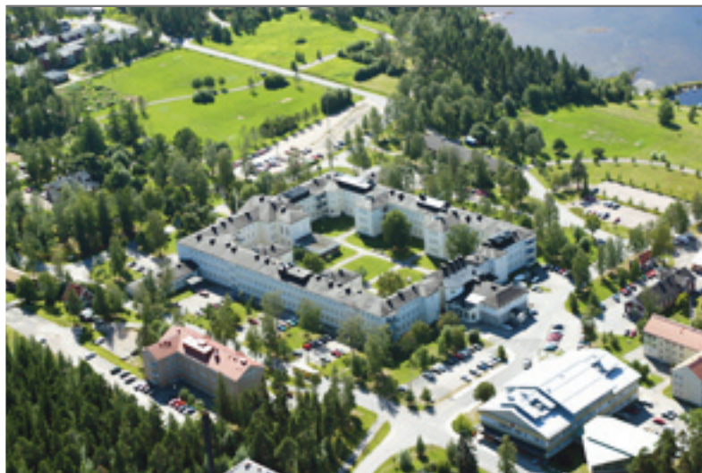
Furunäsets Företagsby - en förebild